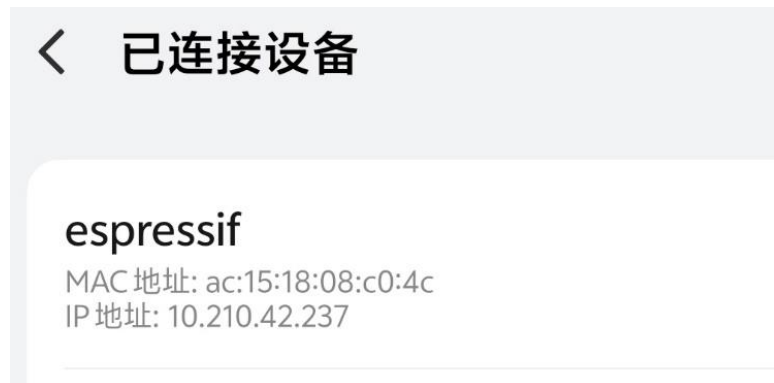
图 4 连接目标 WiFi 成功

步骤 4: 编译文件并烧录，烧录成功后可以看到开发板成功连接了目标 WiFi，如图 4 所示。